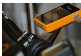
Navigatore GPS € 159,90